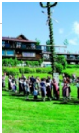
Green Hotel i Tällberg - avkopplande vid Siljan.

4. Björklidens golfbana i Björkliden. Den är en av Sveriges i särklass mest spektakulära golfbanor. Extremt svårspelad, man är tvungen att ligga rätt i förhållande till golfhålen hela tiden.